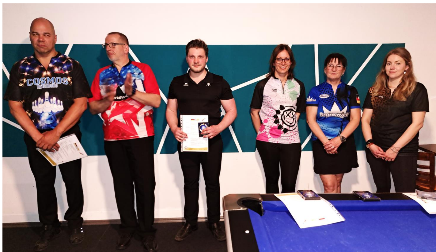
Siegerehrung LM Einzel Damen und Herren